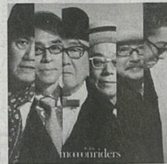
「It's the moonriders」ムーンライダーズ (日本コロムビア COCB-54346、3300円)

途半端に丸くならずとんがっていられるのだと、教えてくれる怪作。メンバー間の、あるいは外部参加者とのスマートな切磋琢磨や濃密な時間が生み出した、アイデア豊かつ奔放なロックに圧倒される。ユーモラスでシニカルなスパイスの効きも上々だ。