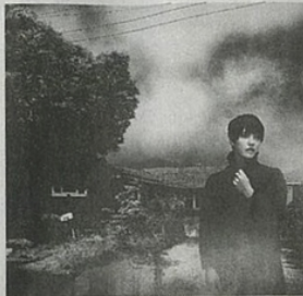
「WE'VE BEEN GOING ABOUT THIS ALL WRONG」シャロン・ヴァン・エッテン (Jagj aguwar JAG395JCD、2750円)

♪ニュージャージー州出身のシンガー・ソングライターによる6作目。シャロンは「私たちがそれぞれの方法で経験したこの2年のジェットコースターの