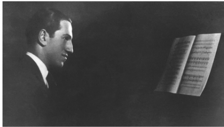
Der amerikanische Komponist und Pianist George Gershwin in einer undatierten Aufnahme.